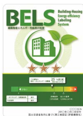
[図1] ガイドラインに基づく第三者認証の例

また、ダイヤモンドリスponsに対応した時間帯別・季節別の電気料金メニューが選択できる場合はその活用にも努めるとともに、エネルギー管理システム（BEMS・HEMS等）の導入により、ビルの運用方法、住宅の住まい方の改善によるピーク対策及び省エネルギーに努めること。