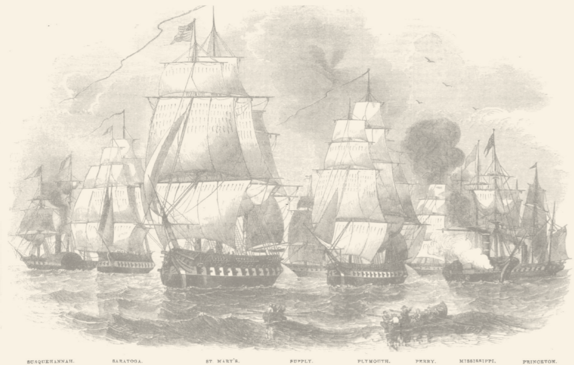
神奈川県立歴史博物館所蔵 「グレスンズビクトリアル」 から （1854年 ペリー日本艦隊横浜来航）