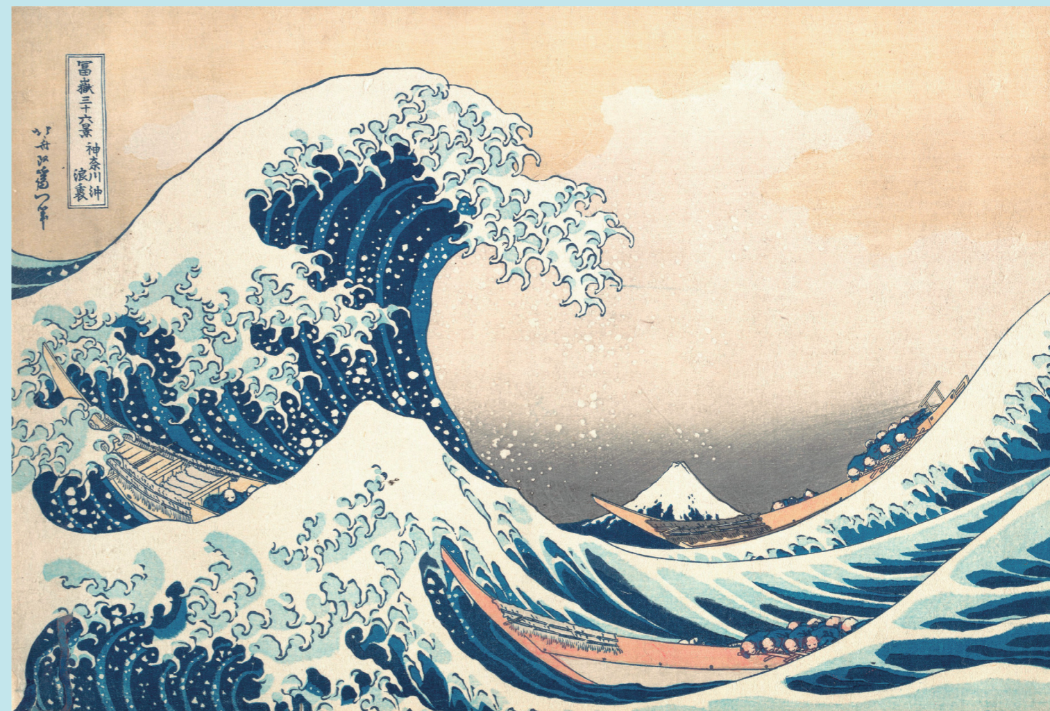
葛飾北斎 富嶽三十六景 神奈川沖浪裏