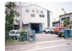
(クリーニング共同工場)