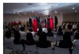
(美容等共同研修施設)